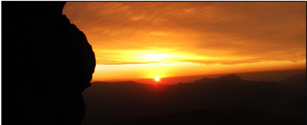
Puesta de sol desde el campamento.

Luego camine hacia el este, ya que la cumbre es una meseta bastante amplia, hasta llegar a la cumbre este, que a simple vista no destaca mas que la oeste, cosa bastante obvia si según el mapa IGM apenas hay cinco metros de diferencia entre una y otra. Este punto es evidente, ya que luego el filo baja hacia el portezuelo que separa el cerro La Calchona del Peladeros.