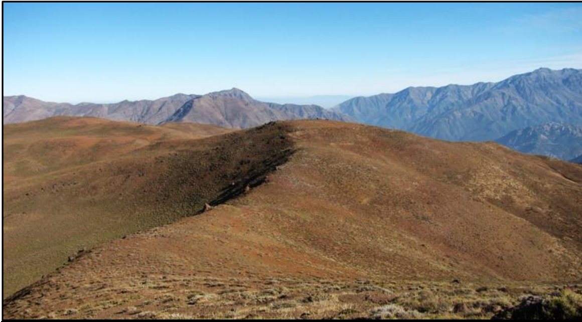
Cerro Lajas desde algún punto del filo que va hacia el cerro La Calchona.

Vale la pena dejar una pirca de piedra en ambas, y la verdad vale la pena visitar ambas en caso de andar por esos lados, no serán 10 minutos de caminata para esos 300 o 400 metros de distancia, con una vista muy linda en todas direcciones. En resumen, la cumbre de este cerro es una amplia meseta cuyo punto más alto -por algunos metros- es el este, hablar de cumbres oeste y este tiene más relación con la representación del cerro en el mapa IGM, donde se distinguen con claridad ambas, pero en la práctica es solo una cumbre.