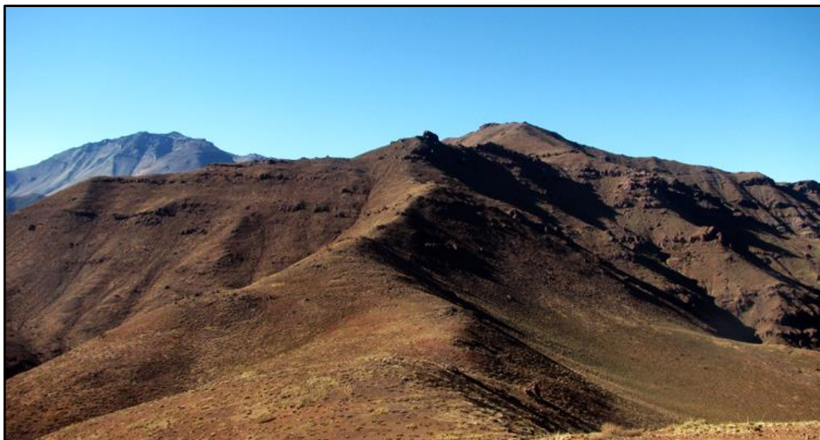
La Calchona desde la cumbre del Lajas. A la izquierda el Peladeros, que en verano le hace mucho honor a su nombre.

Luego camine hacia el este, ya que la cumbre es una meseta bastante amplia, hasta llegar a la cumbre este, que a simple vista no destaca mas que la oeste, cosa bastante obvia si según el mapa IGM apenas hay cinco metros de diferencia entre una y otra. Este punto es evidente, ya que luego el filo baja hacia el portezuelo que separa el cerro La Calchona del Peladeros.