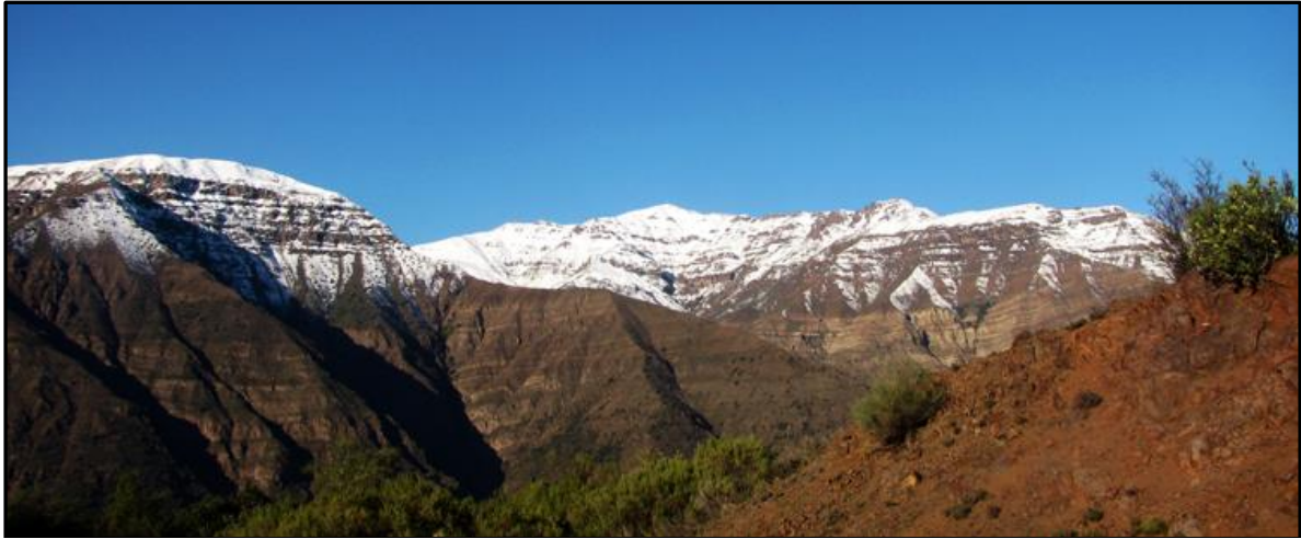
A la izquierda el Lajas, a la derecha el cerro La Calchona.