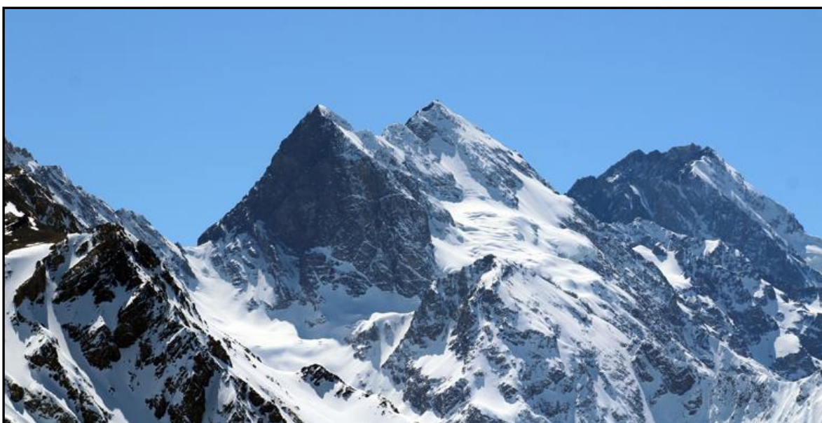
Vista hacia el norte. Morado y Mesón Alto.

Aquí, después de avanzar un poco por el filo hacia el sur, viene la bajada final hacia el fondo de la quebrada El Yesillo. Esta bajada cuando el terreno está seco va por un sendero muy claro y marcado, pero ahora estaba todo nevado, y la nieve sopeada no se veía muy estable, así que no me saqué los crampones. El terreno es sencillo, pero cuando uno sabe lo que hay más abajo igual tiende a concentrarse un poco más, ya que la pendiente termina en unos farellones verticales de bastante altura, así que no hay espacio para resbalones, tropezones o cramponasos.