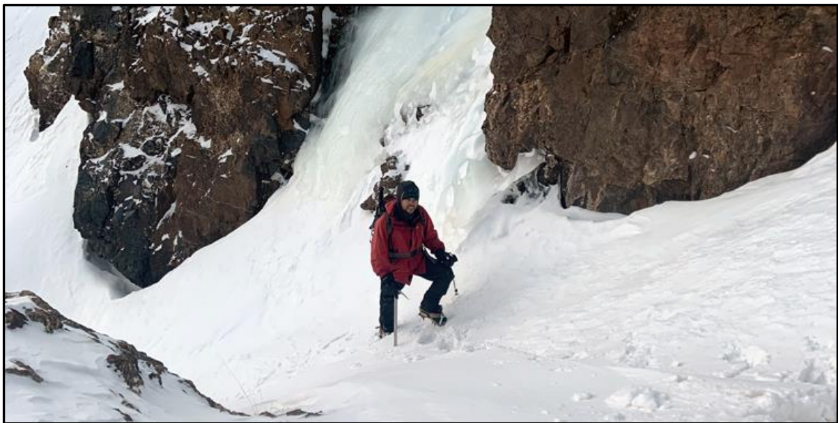
Foto: Cortas y empinadas canaletas con nieve y hielo en el Biguinoussenne.

Eso ya lo habíamos decidido antes de partir, así que continuamos la subida directa enfrentando un inmediato cambio de pendiente, para superar un estrecho canalón que se formaba entre dos promontorios rocosos. Solo íbamos con piolet de marcha, así que subimos con cuidado, ya que la pasada tenía una pendiente más que respetable, de unos 70° y con una caída larga, y si bien la nieve permitía hacer una huella cómoda, a ratos había tramos duros de varios metros donde había que avanzar apoyados solo en las puntas delanteras de los crampones. Entretenido.