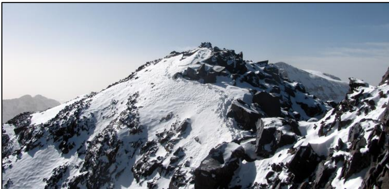
Foto: Cumbre principal desde la cumbre no principal.

Los últimos metros también tuvimos que ganarlos de a poco, rocas sueltas con una capa de nieve blanda hacían que el terreno fuera de cuidado, a pesar de que era menos vertical. Un par de pasadas y divisamos la pirca cumbre, pero sabíamos que el cerro tenía dos cumbres de casi la misma altura, ambas marcadas con pirquitas de piedra, y que la principal era -como siempre- la más lejana.