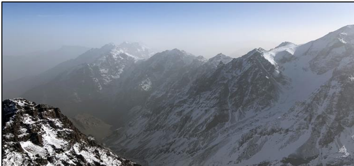
Foto: Tormenta de arena entrando desde el Sahara.

Me sentía muy contento y satisfecho, había planificado un viaje a montañas lejanas, y había salido perfecto, demasiado bien, me sentía demasiado agradecido de todo, de la posibilidad de estar ahí, de la gente que conocimos, de las montañas, del país, de la vida misma. Sacamos las últimas fotos, comimos algunos frutos secos, y nos hidratamos un poco antes de comenzar a bajar. Habíamos decidido bajar por la ruta normal, más tranquila y relajada.