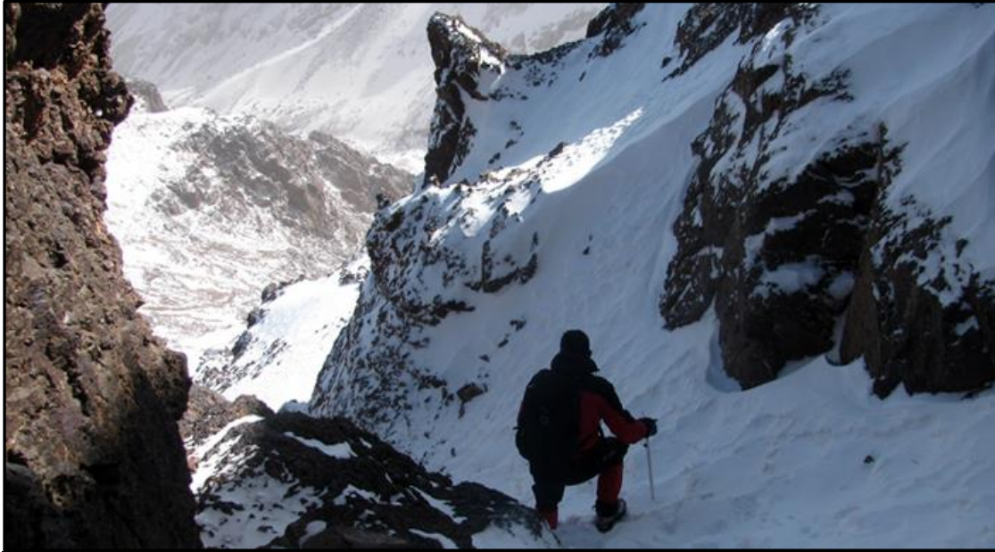
Foto: Comienza el regreso.

Llegó nuestro transporte, y bajo rauda, mucho en mi opinión, desde Imlil a Marrakech, donde nos fuimos a alojar en el mismo Riad en que nos quedamos al llegar. El día de llegada se desató un temporal diluviano, lo que no impidió que saliéramos a recorrer un poco y a comer algo, mientras el agua caía a raudales y la gente corría de un lado a otro, aunque en general la actividad no paraba por el agua.