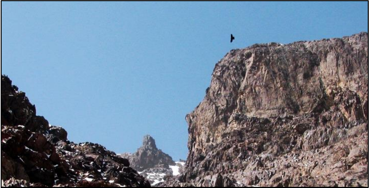
Foto: Entrada a la quebrada Tizi'n Tadat, con el Dedo de Tadat al fondo, y un oportuno pajarraco.

Ya habíamos subido un montón de cerros en pocos días, reído, conversado, y conocido a estas grandes personas de vida sencilla que el destino nos puso por delante, me sentía completamente satisfecho y alegre, contento del solo hecho de estar aquí, y además, nos quedaba un día más para intentar otra cumbre, el físico aguantaba a pesar de que casi no habíamos parado desde que llegamos. Ocho montañas habíamos escaldado y queríamos la última, y por una ruta algo más compleja. Nos decidimos por la directa de la cara NE del Biguinoussenne.