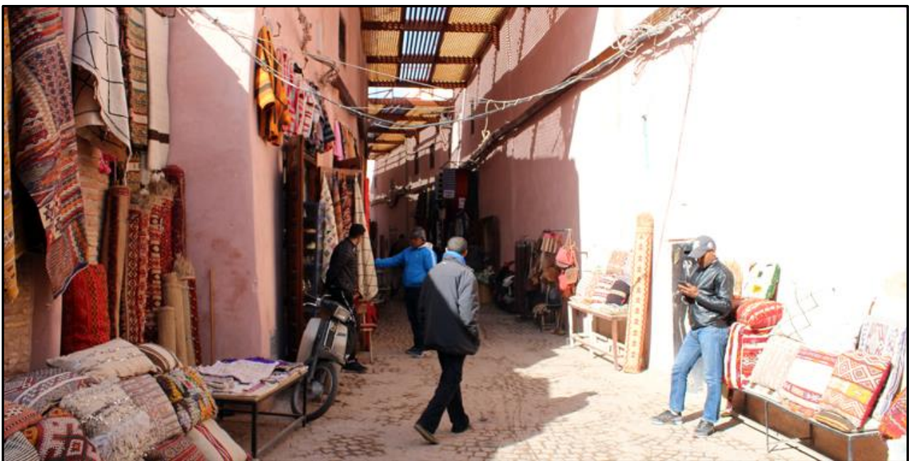
Foto: Callejoncitos de Marrakech.

El día de la partida el mismo chofer que nos trajo de Imlil nos fue a dejar al aeropuerto, ahí pasamos los controles como pudimos. Yo no pongo que soy químico porque a veces me trae problemas, pero mi hermano que es contador, perdió mucho tiempo intentando explicar que hace un contador, parece que pensaban que era un contador de cuentos o algo así, mejor poner administrativo.