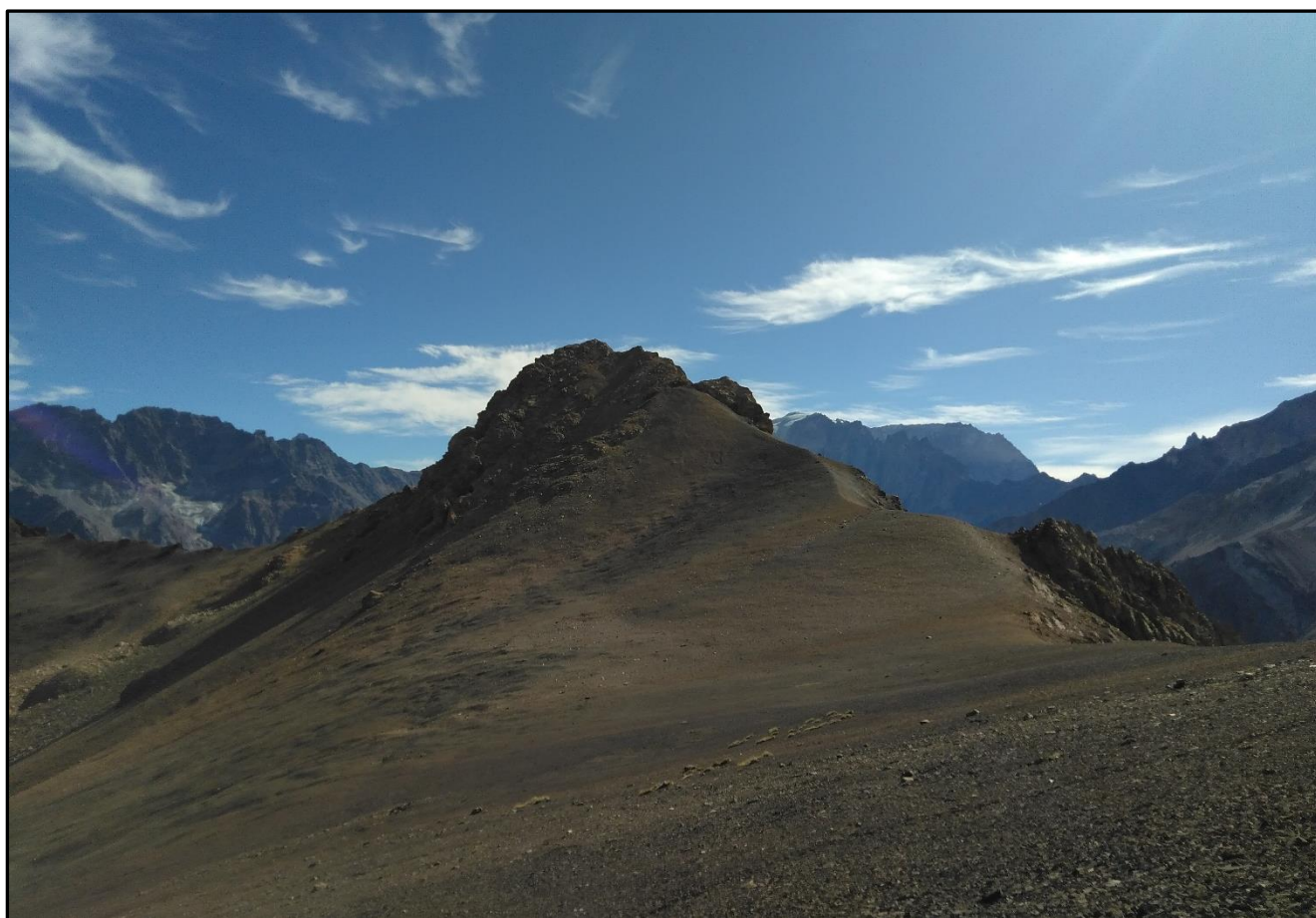
Filo sur del Alto de Arriaza...