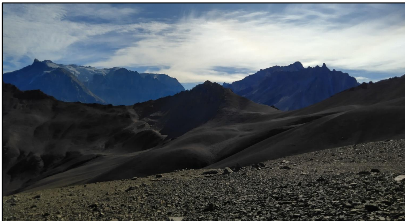
La pequeña pirámide del Alto de Arriaza con el Picos del Barroso y el Paja Grande de telón de fondo.