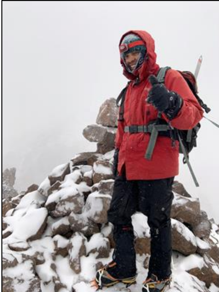
Foto: La hermosa vista desde la cumbre.

La llegada a la cumbre tampoco era para hacerla corriendo, el terreno era expuesto y con un descuido era fácil terminar rodando para cualquiera de los cuatro lados, pero con un poco de atención extra nos paramos con mi hermano en la octava cumbre de este viaje. Felicidad absoluta...