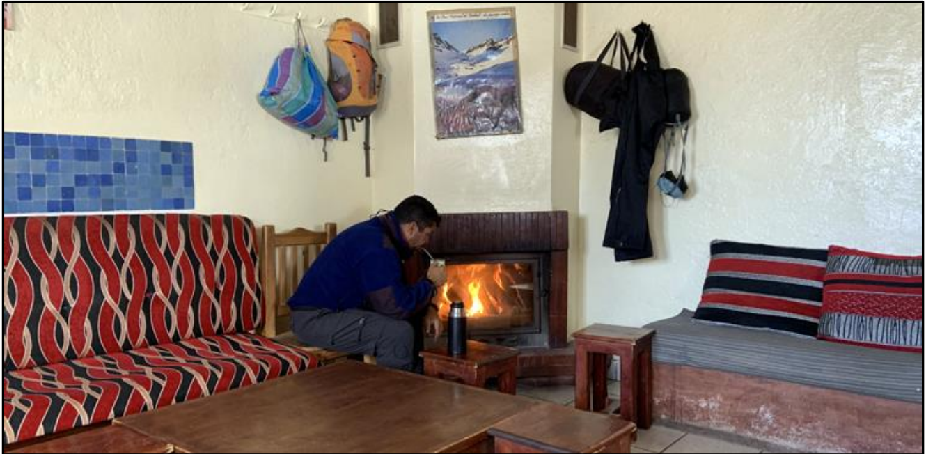
Foto: Vida de refugio...

En fin, fueron muchos problemas que tuvimos que solucionar en el camino, pero aquí estábamos, y ya habíamos agarrado ritmo de cerro, y de refugio. Habrá que ver si en el futuro las normas se ablandan o se afirman, si ocurre lo segundo, tendremos que seguir viendo como el turismo le roba espacios al montañismo.