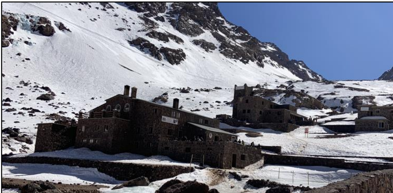
Foto: Refugio Les Mouflons y Refugio Toubkal.

Tipo 06:00 ya estábamos afuera, y el clima estaba malo. Plumillaba y había viento, pero nada tan terrible. Nos pusimos los crampones por que la nieve comenzaba prácticamente al salir del refugio, y comenzamos a darle nomas.