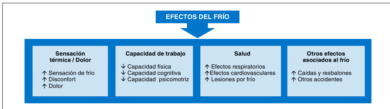
Figura 1. Efectos de la exposición al frío.